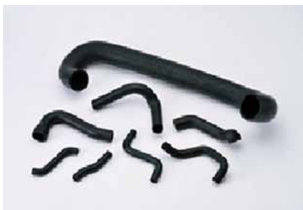
エアクリナー・ラジエーターホース

耐圧用のブレード仕様、及びエア用の総ゴム管で、大口径から、中口径までの、少量多品種の生産を得意としています。