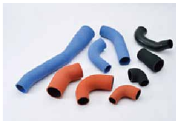
ターボ・インタークーラーホース